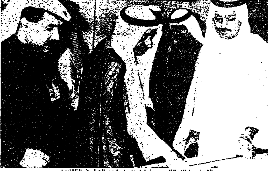
الشيخ سلطان القاسمي يضغط على زر البدء بالعمل في التلفزيون

الشارقة - الأنوار: افتتح الشيخ الدكتور سلطان بن محمد القاسمي، عضو المجلس الأعلى، حكم الشارقة، صباح أمس، تلفزيون الإمارات العربية من الشارقة، وكان في استقباله، لدى وصوله، الشيخ أحمد بن خالد، وزير الإعلام والثقافة، والشيخ محمد مكتوم، مدير دائرة ثقافة وإعلام الشارقة، وعدد من الشيوخ وكوادر الوزارة والمسؤولين وقضاة صلح الدول العربية والأجنبية والشركاء الأجانب التي نفتت الشارقة، وعدد من الفعاليات الثقافية والإعلامية، ورواه الصحف المحلية.